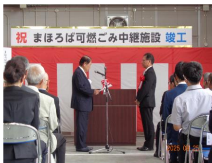
村本建設株式会社に感謝状贈呈