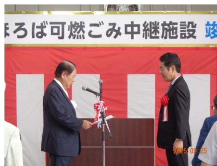
株式会社環境技術研究所に感謝状贈呈